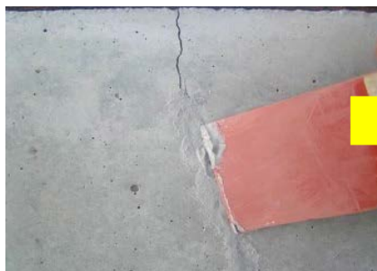
CSパテすり込み状況